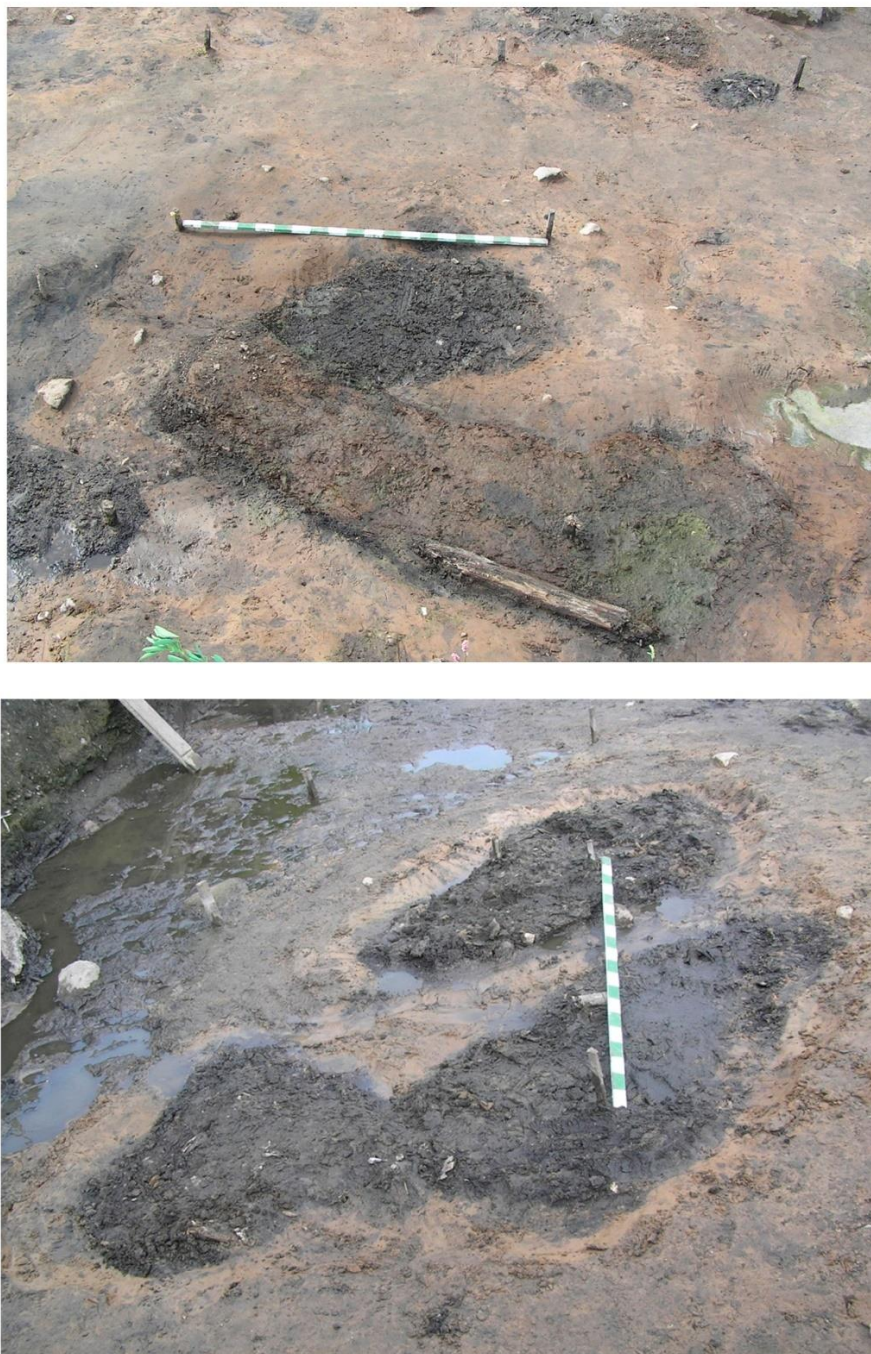
Рис. 1. Ямы для замачивания льна на Петровских раскопах в Пскове.

Рядом (на расстоянии 2 - 2,2 м) была исследована наземная жердевая конструкция для «обтекания» льняной массы (тресты), извлечённой из мочильной ямы. Конструкция составлена из уложенных в два-три ряда брёвнышек (жердей) диаметром от 0,05 до 0,13 м, в конструкции участвуют также колышки диаметром от 0,07 до 0,1 м, вбитые между жердями (главным образом, у торцов), а также у внешней стороны. Общая длина конструкции составляет 6,8 м, ширина до 0,3 м.