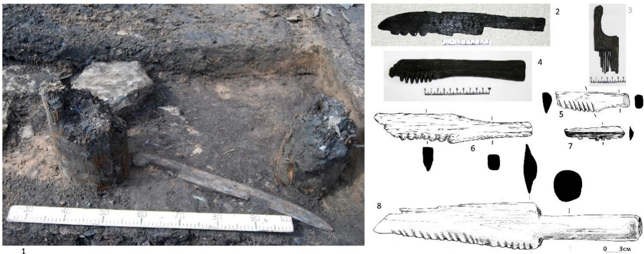
Рис. 2. Деревянный инвентарь, связанный с обработкой льна, из коллекции Петровских раскопов: 1 – льнотрепальный нож на территории двора in situ; 2, 4–8 – чесала; 3 – гребень для шерсти и волокон льна.

Подчеркнём, что на характеризуемом дворе наличествуют нужные природные условия и зафиксированы при раскопках остатки большинства сооружений, перечисленных И.И. Василёвым в описании процесса «мочки, сушки и трепанья» льна [Василев, 1872, с. 71–75]: водоносный «овраг» и собственно ямы, наполняемые грунтовыми водами, развалы камней, коры и сучьев, которыми придавливают лён в ямах, решётка для отбрасывания и обтекания мокрого льна (тресты), установленный на столбах навес для первичного обсушивания «полуфабриката» и даже сани для околачивания льняных головок [Салмина, Салмин, 2011, с. 17–25]. Отметим также значительное присутствие находок орудий для обработки волокнистых растений в вещевой коллекции этого участка: трепала (трепальные ножи), чесала, мялки, вальки (Рис. 2). Большая часть находок хорошо известна и имеет широчайшие аналогии на средневековых памятниках древней Руси и Восточной Европы [Колчин, 1985, с. 265–269, 292–293].